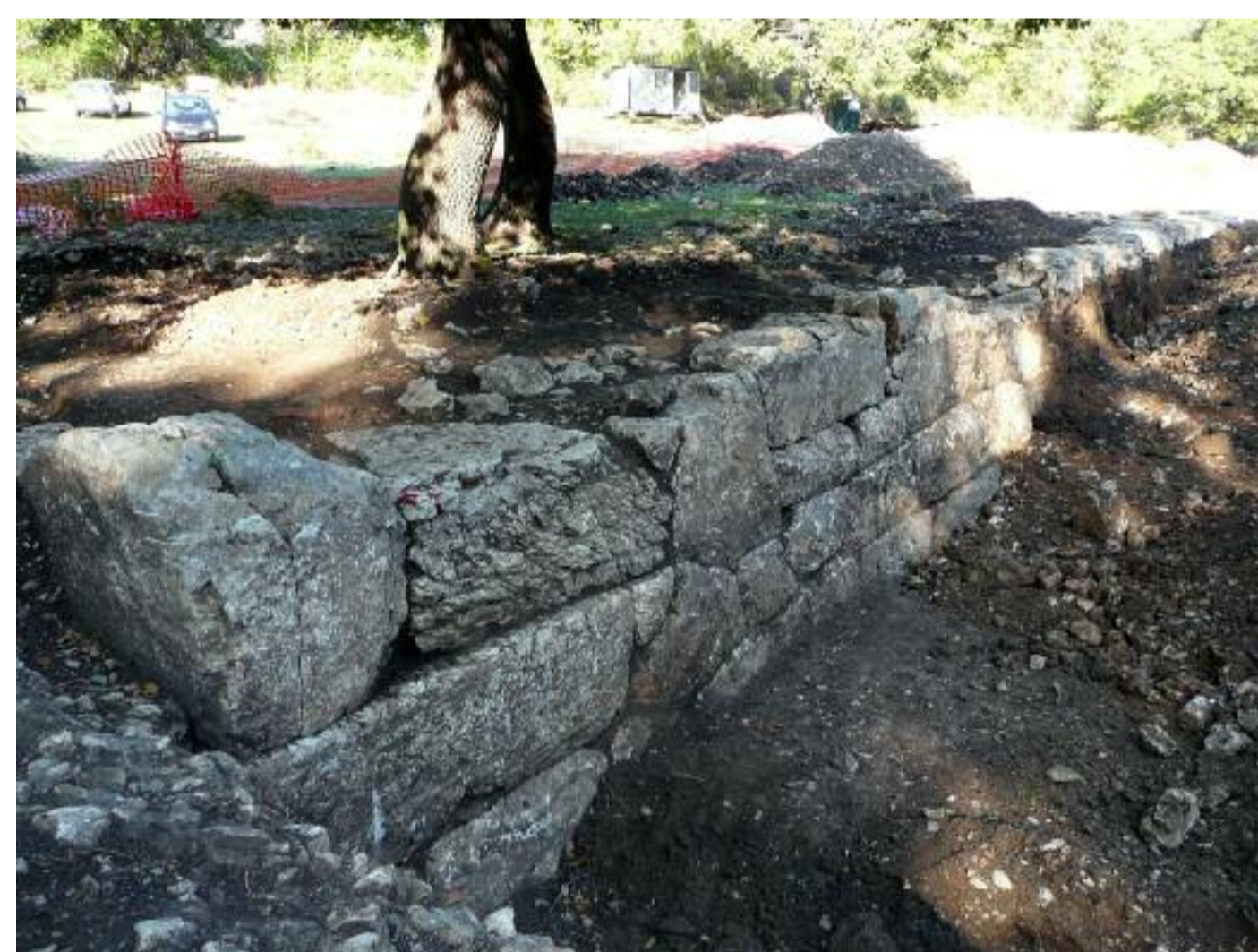
Argine in mura poligonale