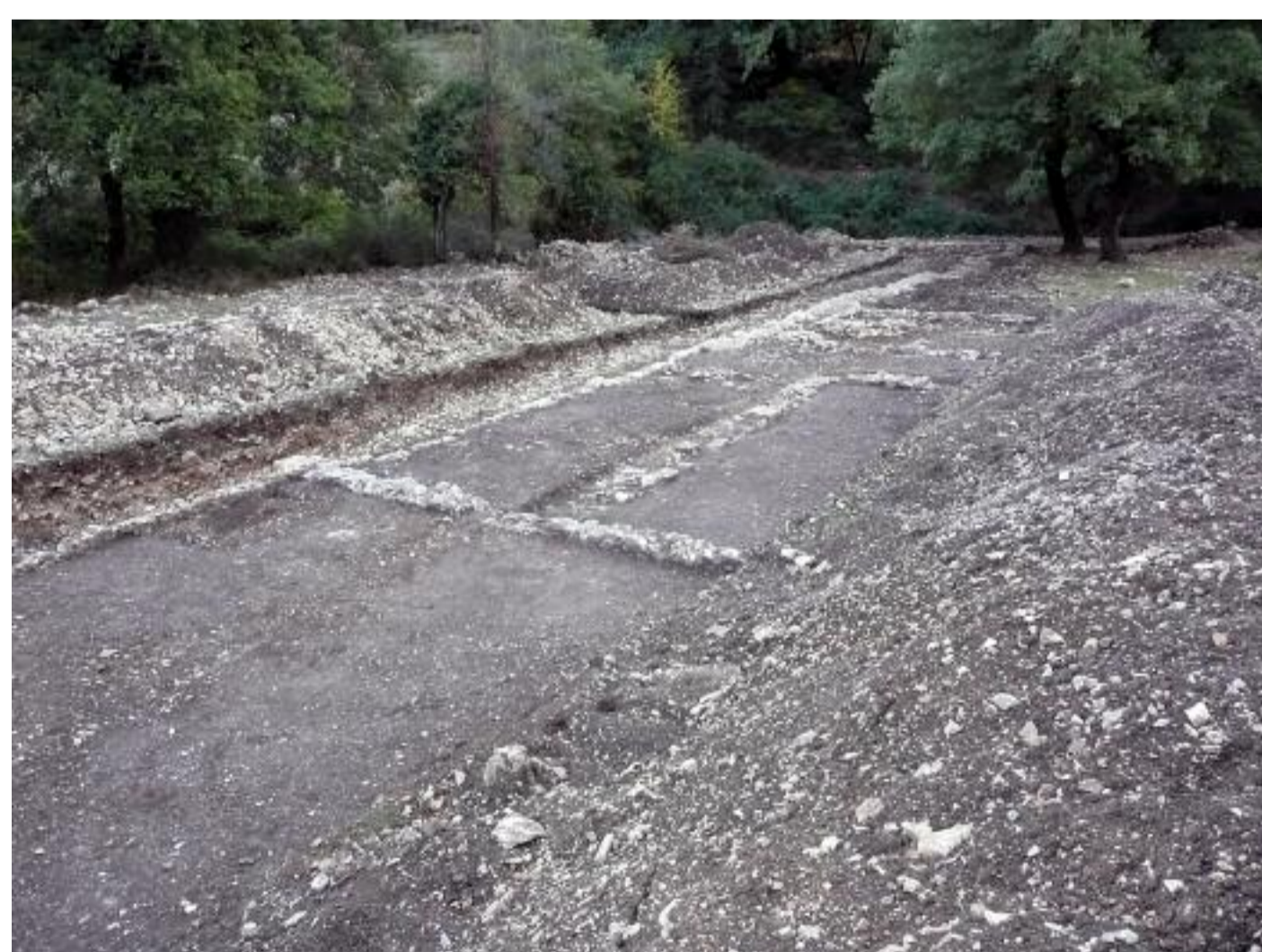
Ambiente sul fosso con connotazione produttiva