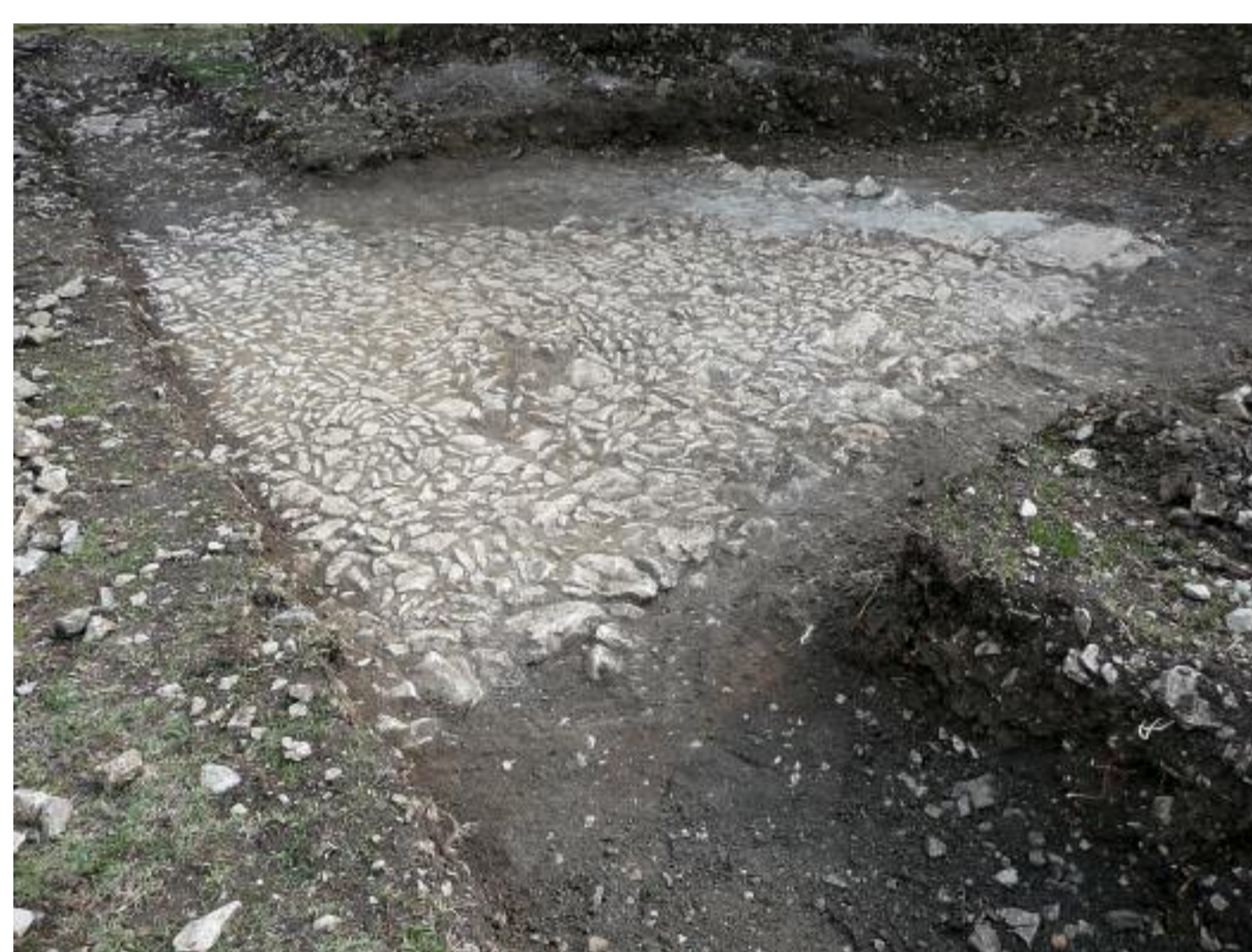
Platea - piazzola di sosta

Lungo il percorso della strada, seguito nelle indagini fino al punto di confluenza tra i due fossi ma noto anche sulle pendici del monte Cimino, è stata individuata una piazzola di sosta, pavimentata in schegge di calcare, ben disposte, ed alcuni ambienti dalle caratteristiche abitative, con muri in blocchi di tufo e in opera reticolata. A ridosso del fosso, si aprono una serie di ambienti con connotazione produttiva, realizzati sul terreno consolidato dai pos-