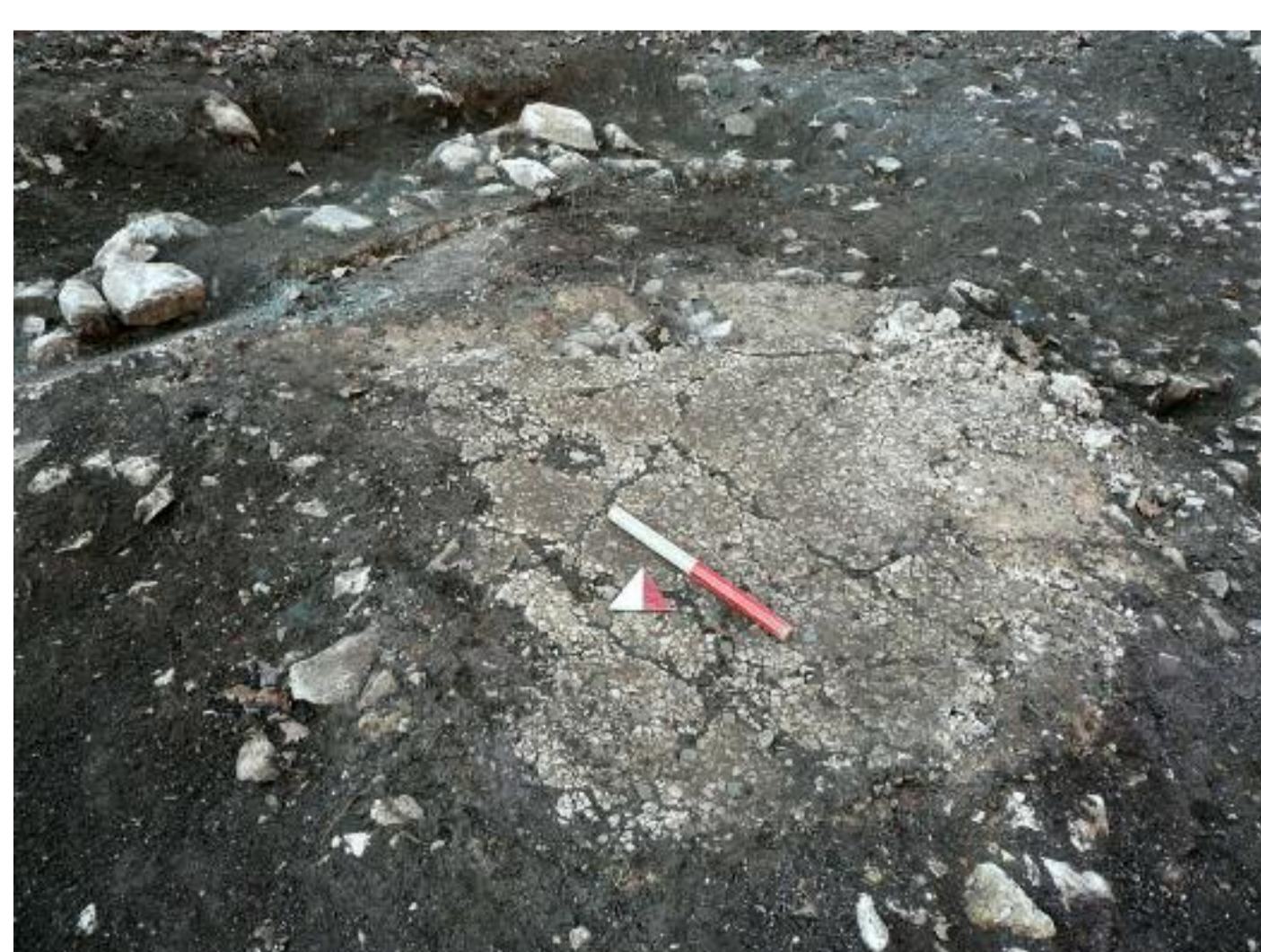
Piano pavimentale con tessere musive nere

senti argini in poligonale corrispondenti alla delimitazione meridionale dell'antico corso del fosso.