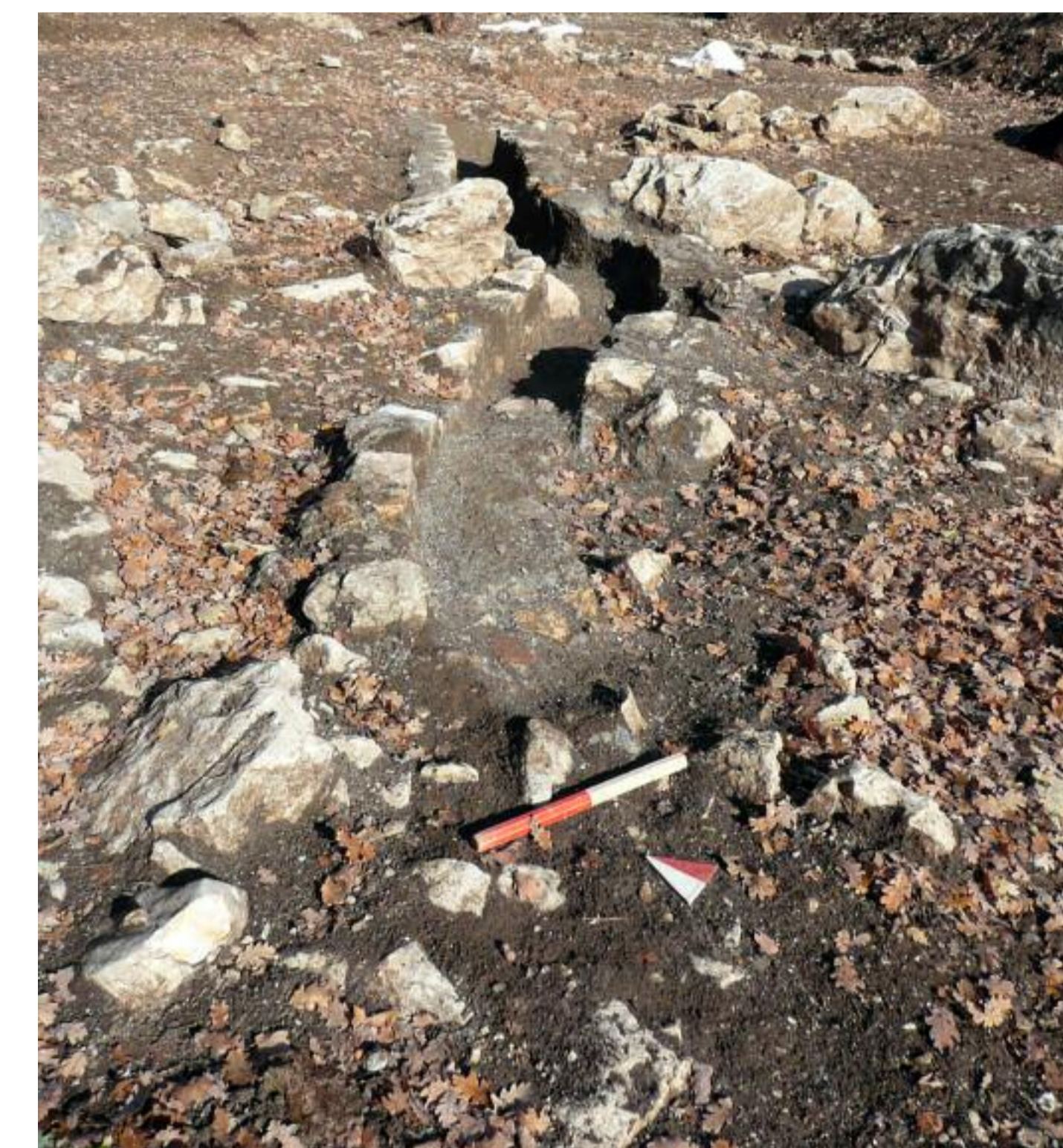
Canale di scolo del pozzo. Sotto, i resti della chiesa medioevale