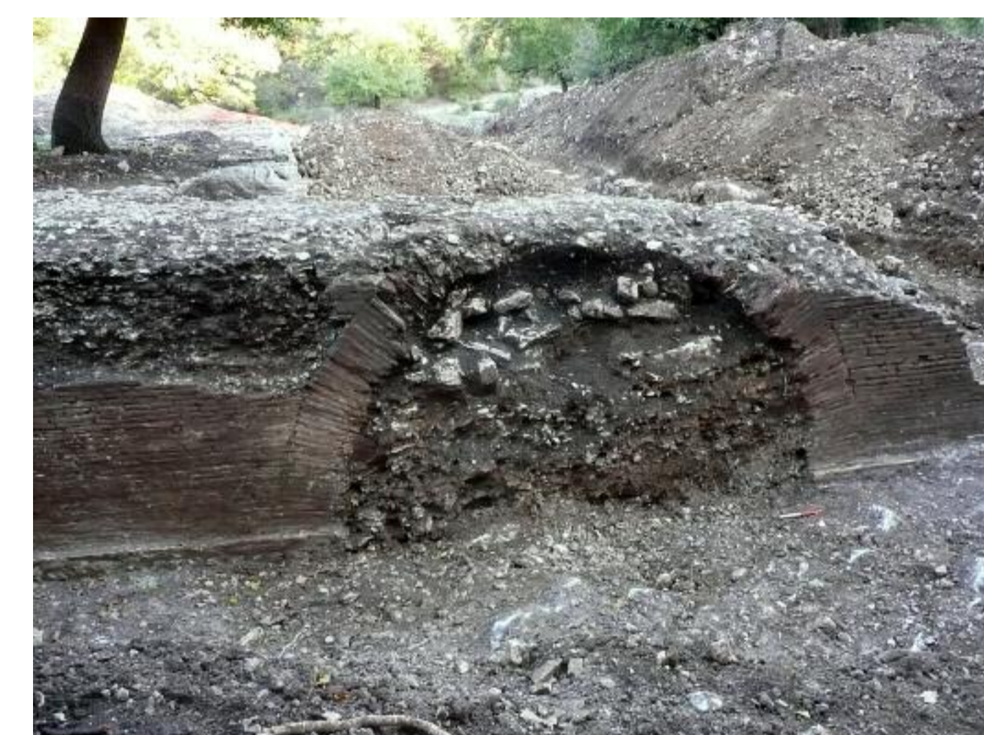
Ponte in opera laterizia

Così come certamente accade per il pozzo quadrato in schegge calcaree e la canaletta di scolo, con spallette in muratura e andamento individuata e scavata immediatamente a Nord dello stesso edificio.